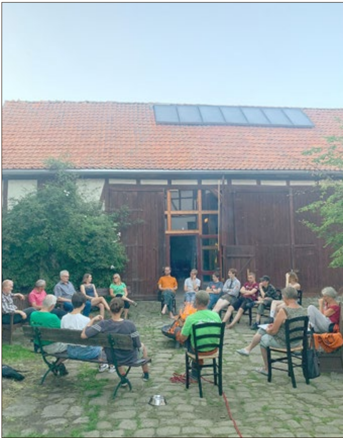
Ein Lagerfeuer als Mittelpunkt spannender Geschichten und guter Gespräche.

Finanziert wird es von der Bundesbeauftragen für Kultur und Medien im Bundesprogramm „Jugend erinnert“, unterstützt von der Bundesstiftung zur Aufarbeitung der SED- Diktatur“. Weitere Förderpartner sind die Stiftung Naturschutz Thüringen und die Heinrich-Böll-Stiftung Thüringen.