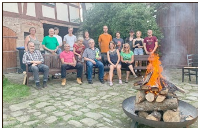
In bester Gesellschaft: junge Menschen treffen am Lagerfeuer auf Zeitzeugen aus dem Eichsfeld.

Asbach-Sickenberg. Welche Geschichten erzählt das Grüne Band? Dieser Frage gehen derzeit acht Jugendliche sowie vier Jugendleiterinnen und Jugendleiter nach. Im Rahmen einer vier-tägigen Schulung des BUND Thüringen und der BUNDjugend Thüringen wandern sie vom Grenzmuseum Schiffersgrund nach Frieda. Unterwegs erkunden sie Spuren der deutschen Teilung und Schätze der Natur, die sich ausgerechnet im Schatten der menschenfeindlichen Grenze entwickelt haben.