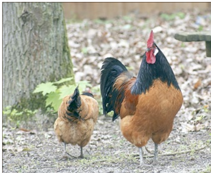
Das Vorwerkhuhn ist eine pflegeleichte, robuste und ruhige Rasse

Jeweils Anmeldung und Information: Natur-Erlebniszentrum Gut Herbigshagen, Sielmann-Weg 1, 37115 Duderstadt, Tel. 05527 914-208, besucherservice@sielmann-stiftung.de .