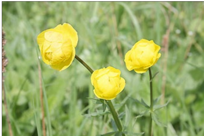
Die zwischen Kreuzebra und Kefferhausen gelegene Hochfläche stellt für Botaniker ein interessantes Exkursionsziel dar. Hier wächst auch die Trollblume.

Anmeldungen an: Naturpark Eichsfeld-Hainich-Werratal | Tel.: 0361 57 3915 010 | poststelle.ehw@nnl.thueringen.de | www.naturpark-ehw.de