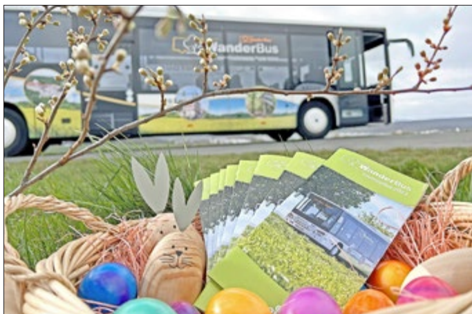
Der WanderBus startet in die neue Saison: Den Flyer mit allen Touren und Infos gibt es in den Bussen und zahlreichen weiteren Ausgabestellen oder online unter www.eichsfeldwerke.de /Start zum Osterfest. Neue WanderBus-Saison beginnt mit Familientour für Groß und Klein.