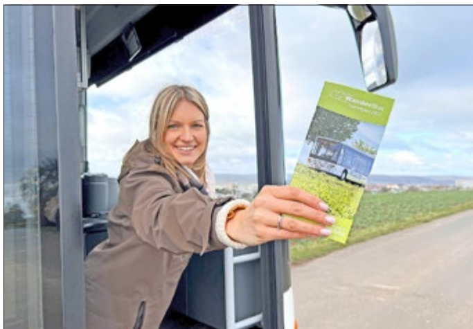
Der WanderBus startet in die neue Saison: Den Flyer mit allen Touren und Infos gibt es in den Bussen und zahlreichen weiteren Ausgabestellen oder online unter www.eichsfeldwerke.de/wanderbus .

Das ganze Programm mit allen Informationen gibt es unter www.eichsfeldwerke.de/wanderbus oder im WanderBus-Flyer, erhältlich u.a. an den Touristinformationen im Eichsfeld, am ZOB in Leinefelde, beim Landkreis Eichsfeld, dem HVE oder im Naturparkzentrum. Rückfragen beantwortet gern Uwe Müller unter Tel. 0361 57 3915 004.