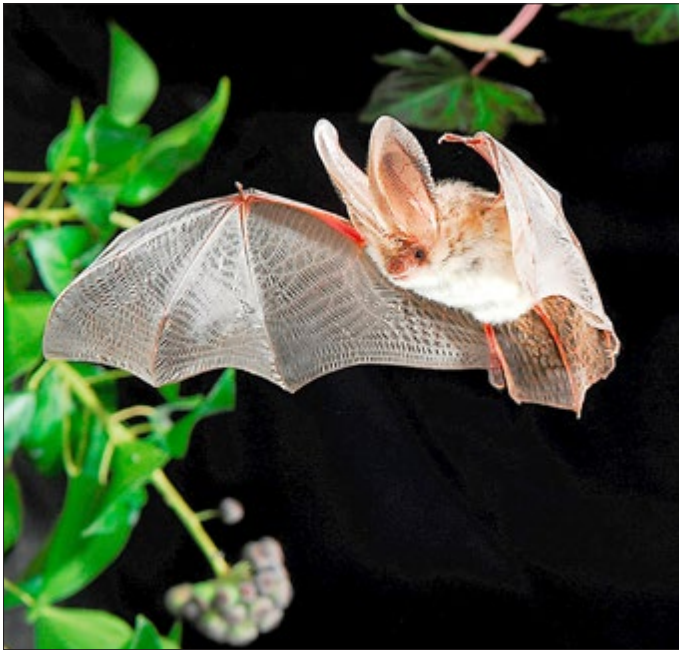
Das auffälligste Merkmal beim Braunen Langohr sind die Ohren, die mit etwa 4 Zentimeter Länge beinahe so lang sind wie der Körper.

Fledermäuse haben schon im Mittelalter die Gemüter der Menschen erregt. Es sind sehr heimlich lebende Tiere. Den Tag verbringen sie geschützt in Verstecken und nachts fliegen sie umher, um Insekten zu jagen. Bei der Orientierung hilft Ihnen ein geheimnisvoller Sinn, die Ultraschall-Echo-Ortung. Damit sind sie in der Lage, Insekten auch nachts in tiefer Dunkelheit zu jagen - im Gegensatz zu den tagaktiven Vögeln. Bei der Wanderung um den Seeburger See werden die Teilnehmer neben Aspekten der Ortung und des Fluges die speziellen Ansprüche an den Lebensraum kennen lernen sowie Wissenswertes über den Fledermausschutz erfahren. Ab der Dämmerung kommen die Ultraschalldetektoren zum Einsatz. Die Mitnahme eines Fernglases wird empfohlen. Parkplatz Graf Isang, 37136 Seeburg. Erwachsene 15 Euro, Kinder bis 12 Jahren 12 Euro.