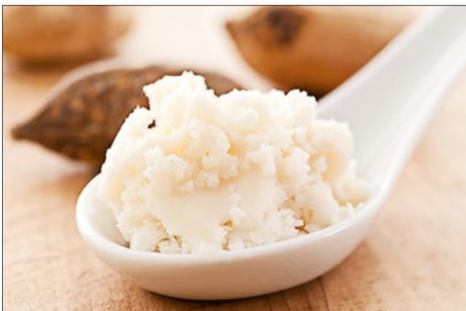
ZoonaSheabutter ist eines der Naturprodukte, das unter anderem für die Haar- und Hautpflege verwendet kann. Weitere Angebote unter www.gut-herbigshagen.de .

Tierversuche, bedenkliche Inhaltsstoffe, Mikroplastik und jede Menge Verpackungsmüll: Es gibt gute Gründe, auf herkömmliche Kosmetik zu verzichten. Bei selbst gemachter Kosmetik bzw. Naturkosmetik weiß man genau, was drinsteckt. Außerdem lassen sich die Cremes, Shampoos und Seifen individuell auf die eigenen Bedürfnisse abstimmen. 18,50 Euro/Person inkl. 6 Euro Materialkosten. Anmeldung bis Freitag, 5. Mai, erforderlich.