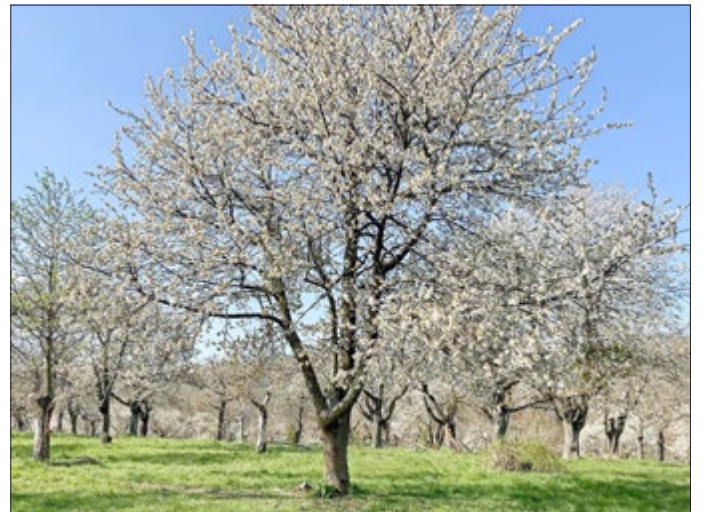
Ein strahlend weißes Blütenmeer eröffnet sich dem Besucher auf der Kirschplantage unweit der Burg Normannstein.

Wo? Wanderparkplatz „Hand“ oberhalb Burg Normannstein, 99830 Treffurt Wann? 10:00 Uhr Dauer? circa 4-5 Stunden, Wegelänge 12,1 km Anmeldung? erforderlich bis 05.05.23