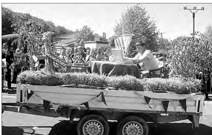
Ist der Bauer nicht auf dem Feld, sitzt er zu Haus und zählt sein Geld