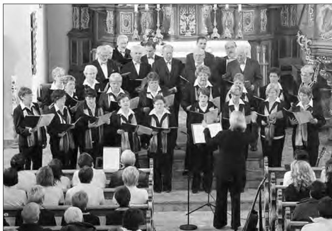
Kirchenchor „St. Jakobus d. Ä.“ Uder