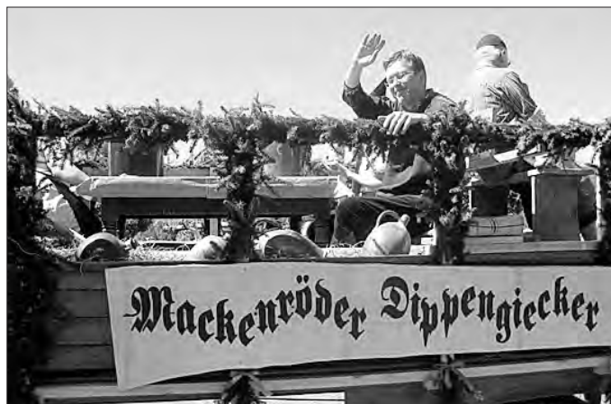
Schauen nicht nur in Töpfe, sondern sind auch mit dem Töpfern vertraut