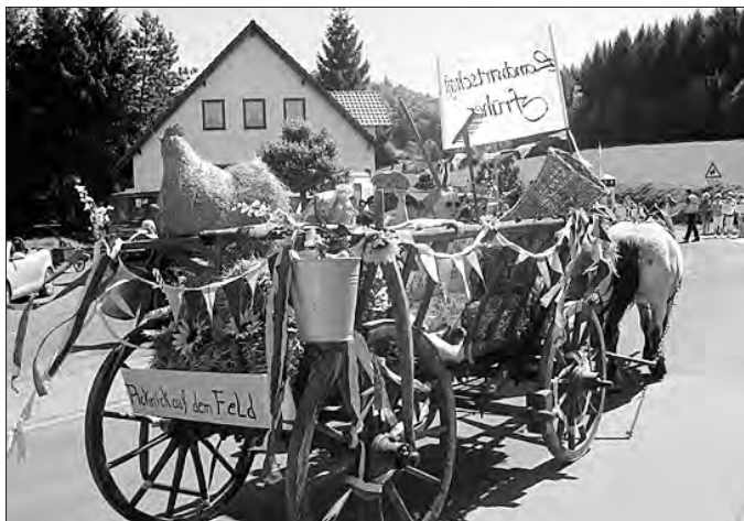
Landwirtschaft früher - Picknick auf dem Feld