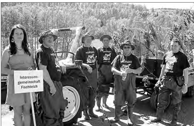
Die Interessengemeinschaft Fischteich...