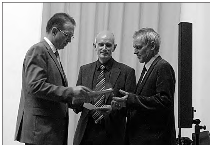
Der Vorsitzende des Kreissportbundes überreichte die Ehrennadel des Landessportbundes