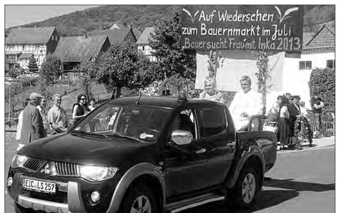
Bauer sucht Frau

Weitere Bilder finden Sie unter www.vg-uder.de