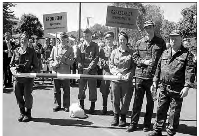
Achtung Sperrzone, Besucher unerwünscht