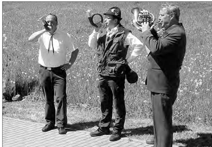
Die Jagdhornbläser eröffneten den Umzug