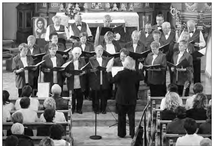
Chor „Luttertal“ aus Lutter