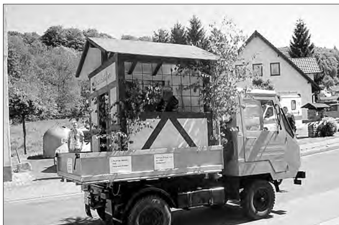
Der Brandstifter in Sicherheitsverwahrung