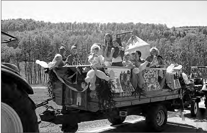
Die Kinderschola von der Märchenstraße, Rotkäppchen u. a.