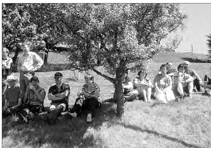
... machten es sich am Rande gemütlich