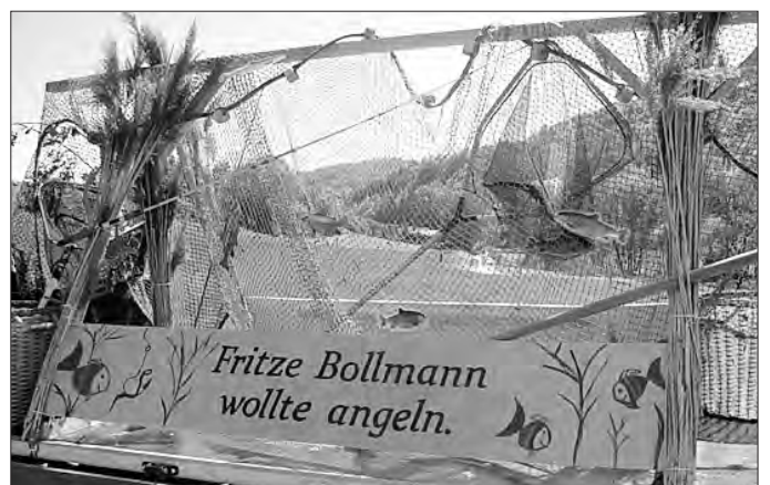
... auch ohne Angel erfolgreich