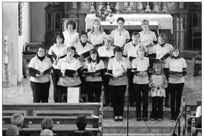
„La Nostra Vita“ Thalwenden