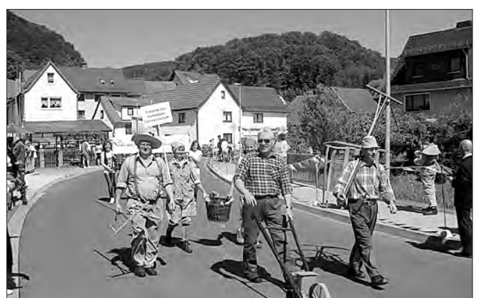
Nicht Pferdestärken, sondern Arbeitskräfte