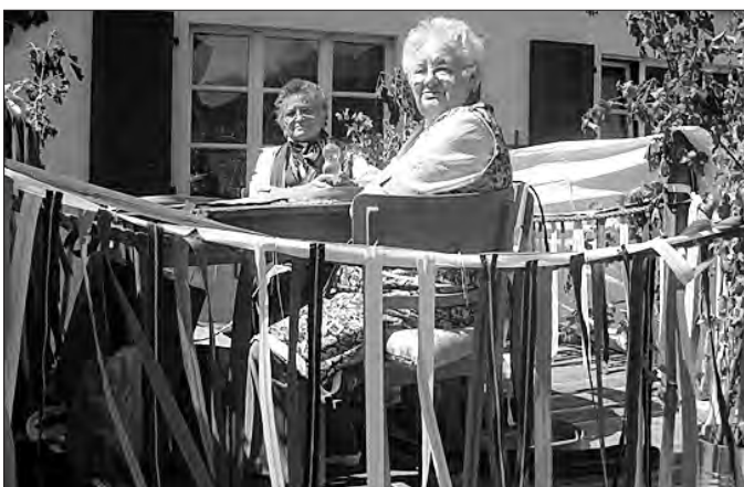
Heimwerker von Solidor