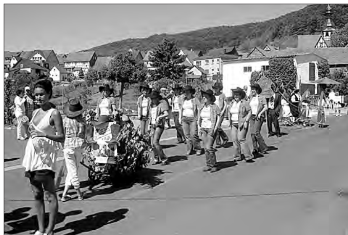
Line Dance Mackenrode