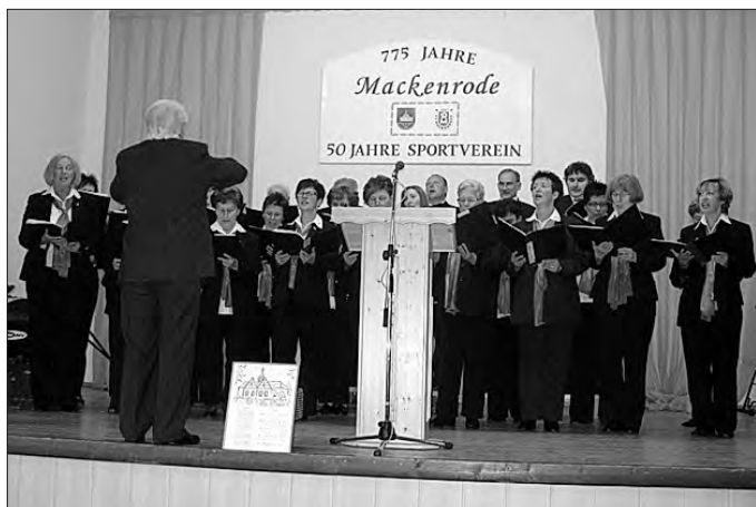
Der Chor eröffnete die Veranstaltung