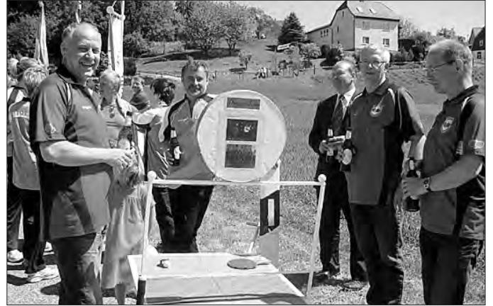
Die Tischtennisspieler des SV Mackenrode