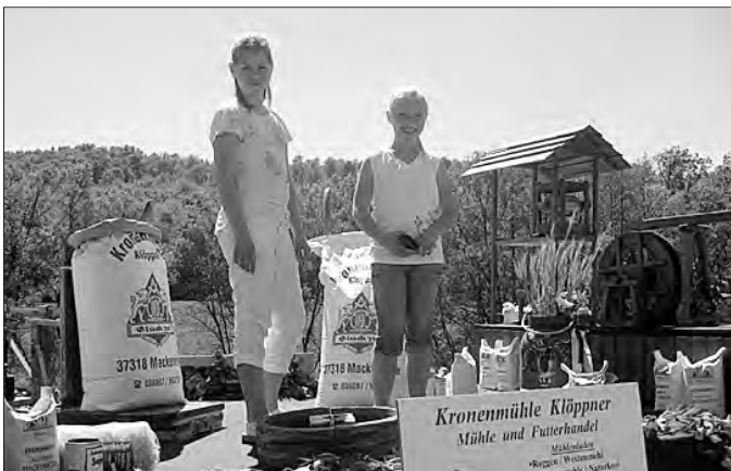
Ein vielfältiges Angebot