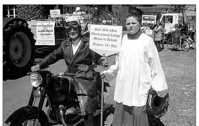
Pfarrer auf Rädern