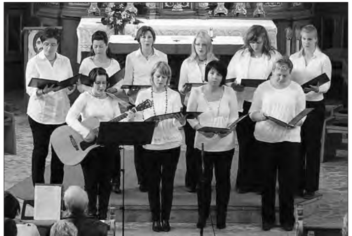
Schola „Regenbogen“ Lenterode