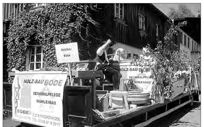
Solides Eichsfelder Handwerk