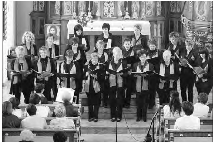
„a colori“ und Karlshofchor Birkenfelde