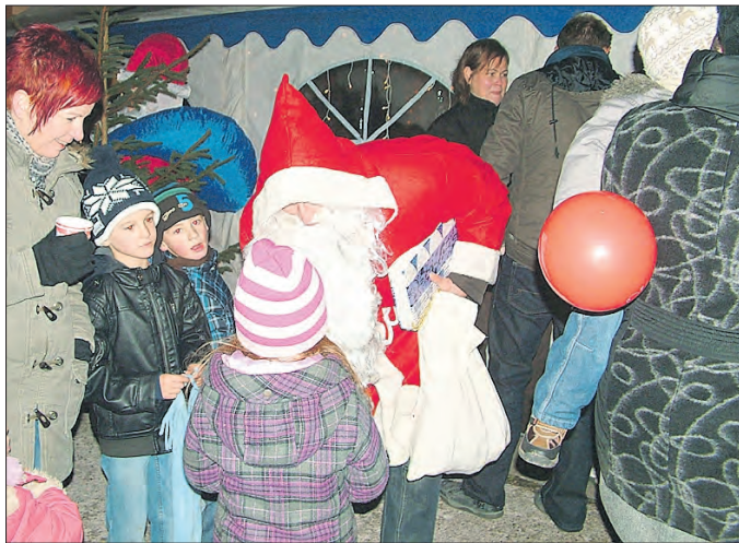
Der Nikolaus kommt...